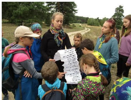
Na výpravě ze Bzence