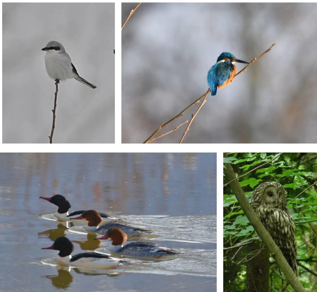
tuhýk šedý ledňáček říční morčáci velcí puštík bělavý