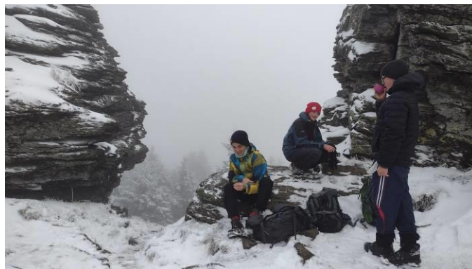
podzimní výpravy do Jeseníků