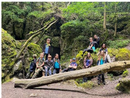
Výprava do Křtin a do Rudického propadání